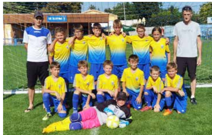
Družstvo mladších žáků JmKFS „B“

Bzenec předvedl solidní výkon, zejména v útoku. Desátý zápas Slavkov-Bzenec 0:2. Skvělý defenzivní výkon a důležité vítězství. Tým hrál koncentrovaně, využil šance a zvládl udržet čisté konto, což je výborný výsledek. Jedenáctý zápas Bzenec-Podluží 3:1. První poločas hráči nevyužili svoje šance a svojí jedinou střelou dal soupeř kontaktní gól. Hráče to ale nepoložilo, dali další dva góly a udrželi si vedení. Dvanáctý zápas Lanžhot-Bzenec 1:2. Vyrovnaná hra obou týmů, ale ten náš byl zaslouženě odměněn všemi třemi body. Už jen stačí odehrát poslední zápas, tak snad bude vítězný.