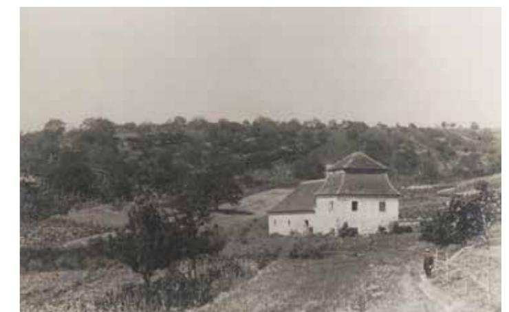
Jezuitská buda na snímku z počátku 20. století.