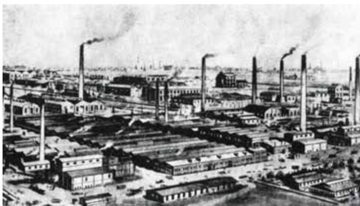
Chemická továrna v Griesheimu.