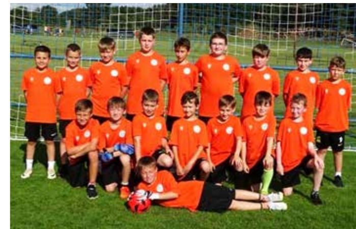
Družstvo starší přípravky Okresní liga OFS Hodonín.