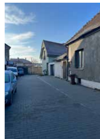
Propoj ulice Tyršova a Vracovská