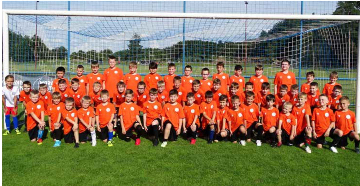
Družstvo mladší přípravky Okresní liga OFS Hodonín.