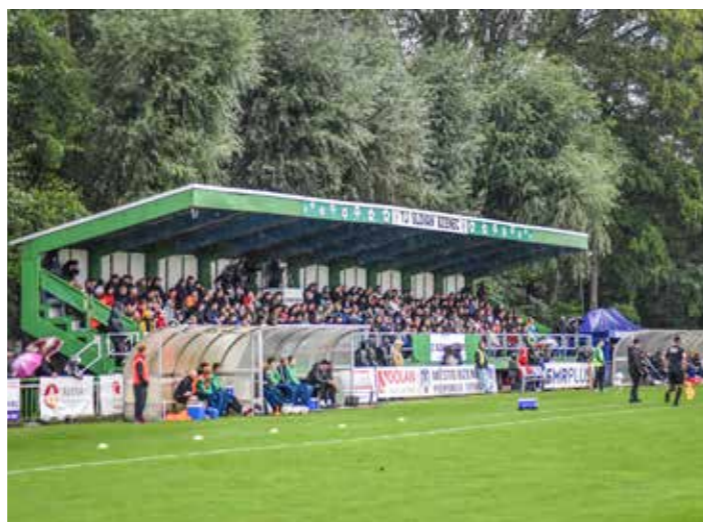
Utkání se Sigmou Olomouc, kterého se zúčastnilo 1300 diváků

Po podzimním 5. místě jsme po dobrých výsledcích v jarní části soutěže v konečné tabulce ročníku 2023/2024 skončili na 2. místě. Ze všech skupin (3) divizí jsme z týmů na druhém