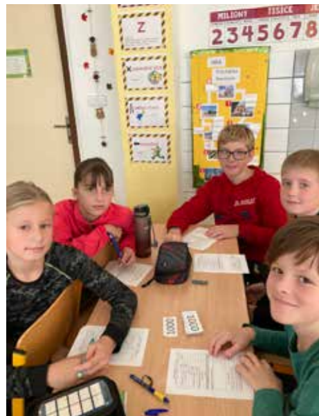
Etické dílny – finanční gramotnost II

Ekolympiáda Olympiáda mediální gramotnosti Přírodovědný klokan Logická olympiáda Pythagoriáda BRL0H – Brněnská logická hra IT Fitness test Stromy a my Plavecké závody Fotbalový pohár FAČR a jiné.