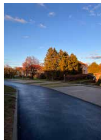
Ulice P. O. Hvězdoslava