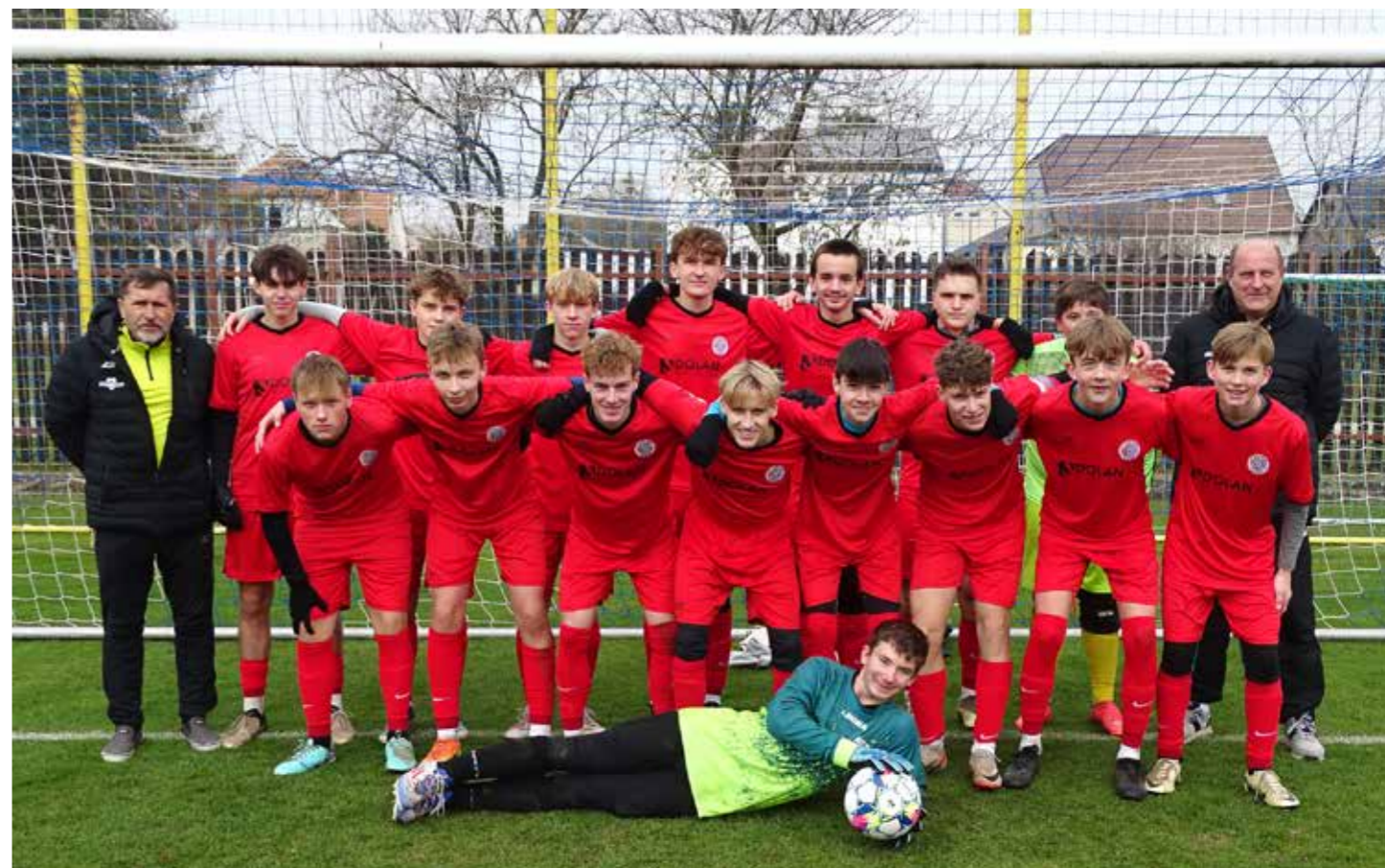
Družstvo dorostu 5. liga JmKFS „C“

U dorostenců byla během minulé sezony velká fluktuace, více jak polovina kádrů nám odešla nebo skončila. Do nové sezony přišlo několik šikovných hochů ze žáků, kteří do kádrů zapadli.