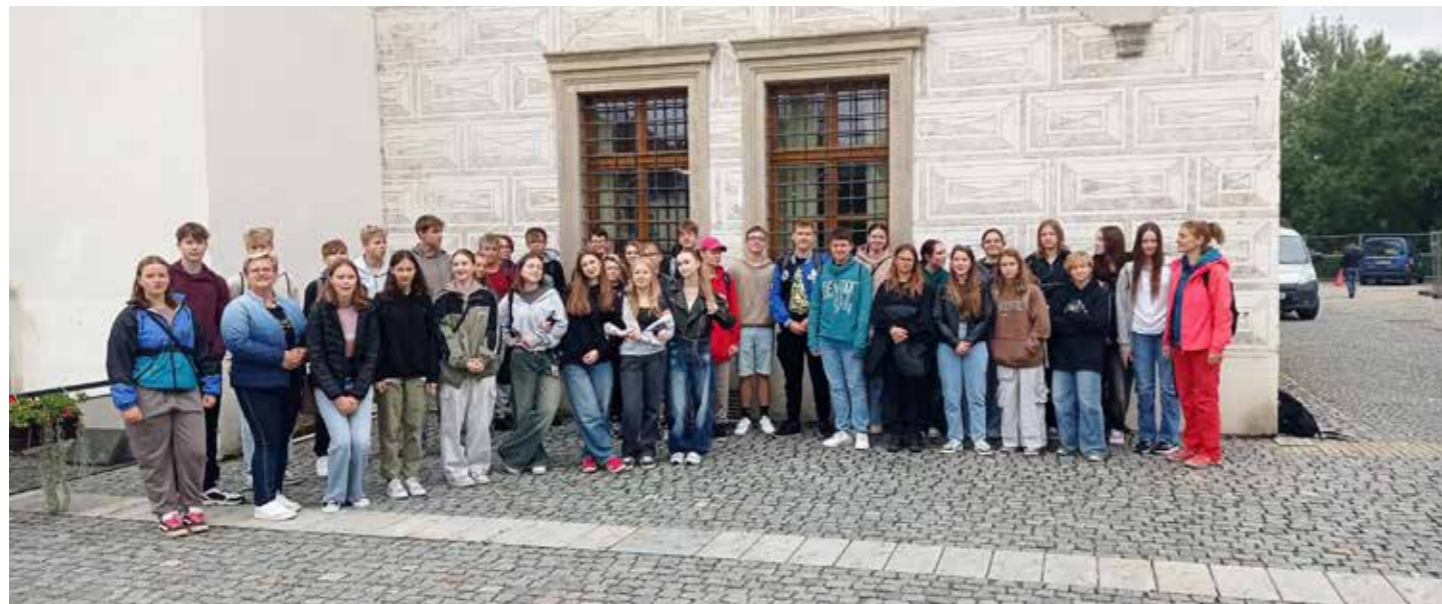
Devátáci před kyjovskou radnicí

Kromě běžného vyučování jsme hned od září spustili spoustu aktivit výuku doplňujících. O většině z nich vás informujeme na našich webových či facebookových stránkách, text níže je spíše neúplným výčtem těchto aktivit (kdybychom je měli popsat podrobněji, zaplnili bychom zřejmě všechny stránky Bzeneckého zpravodaje).