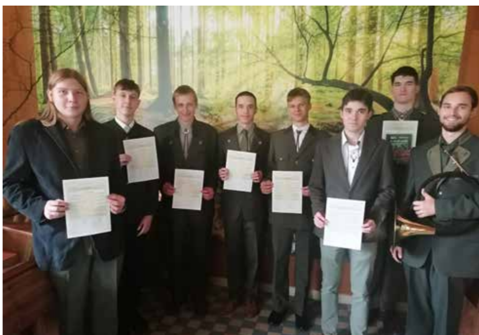
Zkoušky z myslivosti

V závěru měsíce října se uskutečnilo Okresní kolo turnaje ve stolním tenise v Hodoníně. Z Přívozu bylo do turnaje přihlášeno jedno dívčí a jedno chlapecké družstvo. V silné konkurenci se děvčatům podařilo vybojovat krásné druhé místo. Chlapci celkově obsadili třetí místo. Celý turnaj probíhal v příjemné atmosféře a všichni ukázali týmového ducha. Všem našim reprezentantům blahopřejeme.