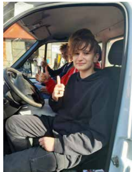
Návštěva služeb města Bzenec I

Spolupracujeme se spolkem Magnet , jehož trenéři nabízejí dětem zábavné pohybové aktivity zaměřené na vnímání těla, relaxaci a kolektivní spolupráci – o jejich hodiny je skutečně velký zájem.