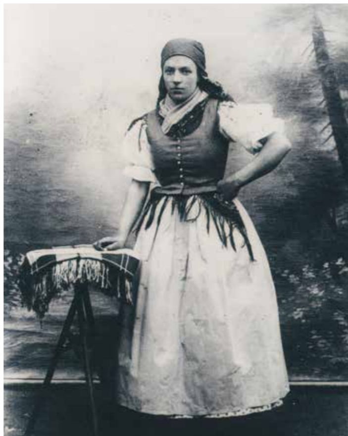
Převzato od zájmového spolku „Starý Bzenec“