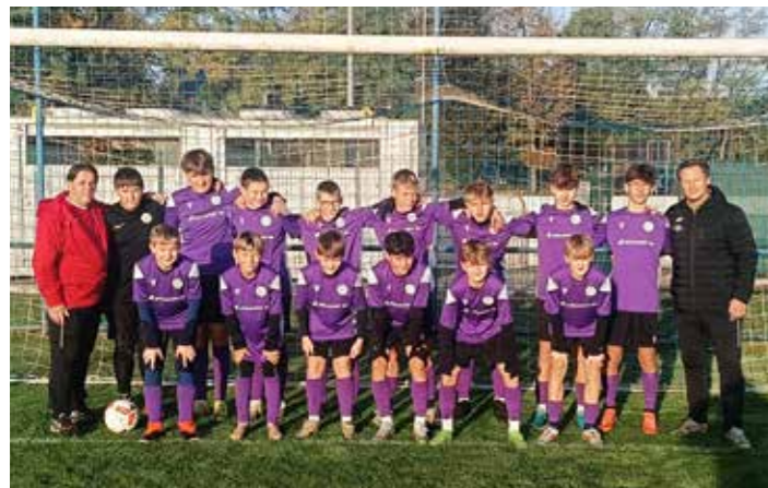
Družstvo starších žáků JmKFS „B“