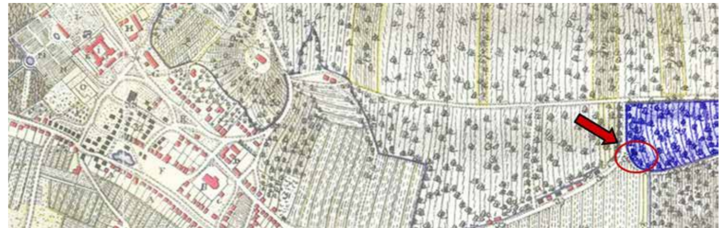
Na výřezu z mapy Bzenec z roku 1728 je jezuitská vinice zvýrazněna modře a označena číslem 39. Buda se nacházela u rozcestí při jihozápadní hranici pozemku a je označena číslem 38.