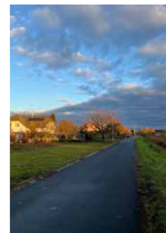
Ulice K. Klostermanna (odbočka)