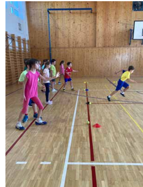
Tělocvik se spolkem Magnet