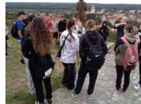
Spolupráce se Zámeckým vinařstvím