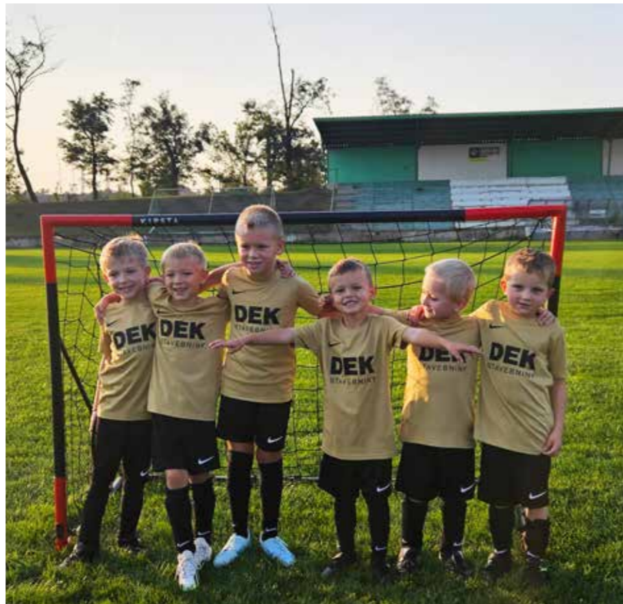
Družstvo mini přípravky U7.

Velké poděkování za podporu bzeneckého fotbalu patří městu Bzenec a sponzorům, kterými jsou: SMR Plus s.r.o., Nadace Andělina manželů Holešinských, RI okna a.s., Kyocera AVX, Decro Bzenec spol. s.r.o., Roth Czech s.r.o., Autojeřáby Dolan s.r.o., Autogas-Desta servis s.r.o., Fastek spol. s.r.o., sportovní vybavení Penalty.cz, Fotbalservis.cz.