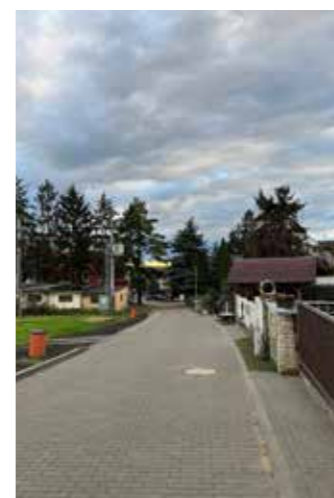
Ulice Pod Vinohrady