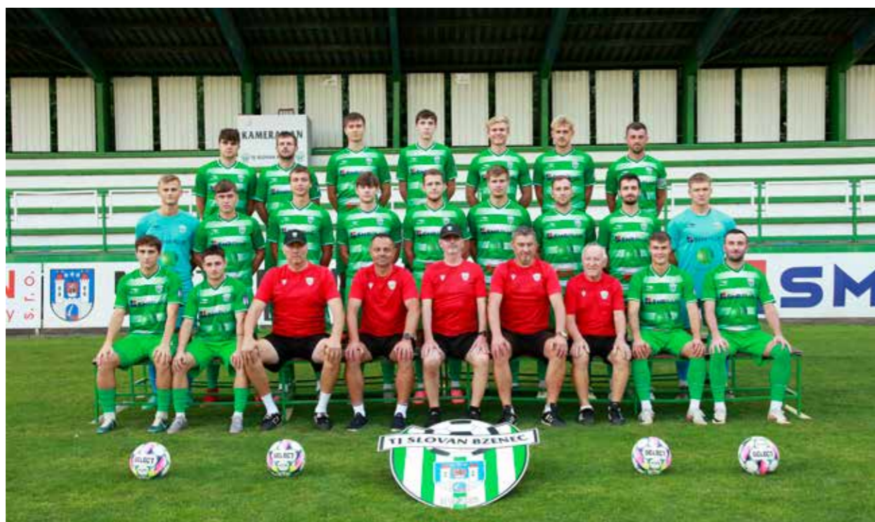
Družstvo mužů „A“ 4. Moravskoslezská liga „E“

V jarní mimořádné dotační výzvě Národní sportovní agentury jsme uspěli s naší žádostí a po několika letech marných pokusů jsme získali dotaci na výstavbu hřiště s umělou trávou. V této mimořádné dotační výzvě (jaro 2024) jsme jediným fotbalovým klubem v České republice, který finanční podporu získal. Hřiště už se nyní buduje a hotovo by mělo být na jaře 2025. Samotný A tým trénuje 3 x týdně a momentálně se pohybuje v dílčí tabulce divize (ponovu 4. ligy) ročníku 2024/2025 mezi prvními pěti týmy soutěže.