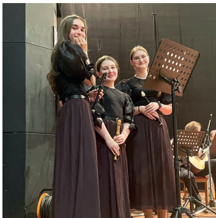
Flétnistky na Svátku matek