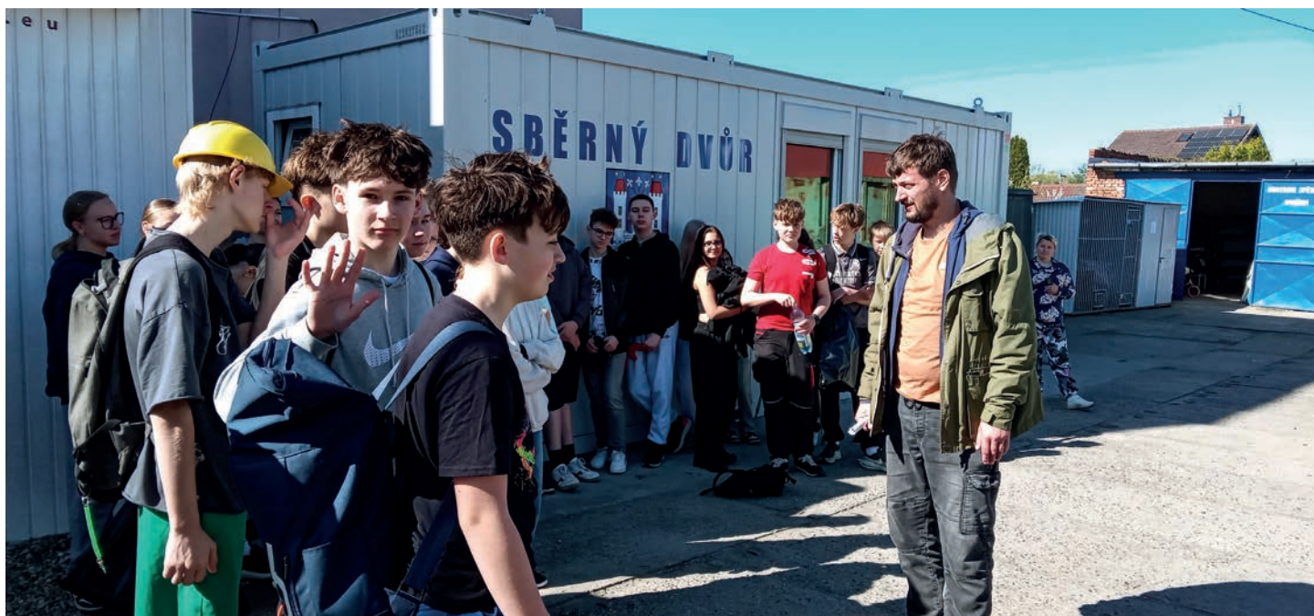
Den Země – návštěva sběrného dvora