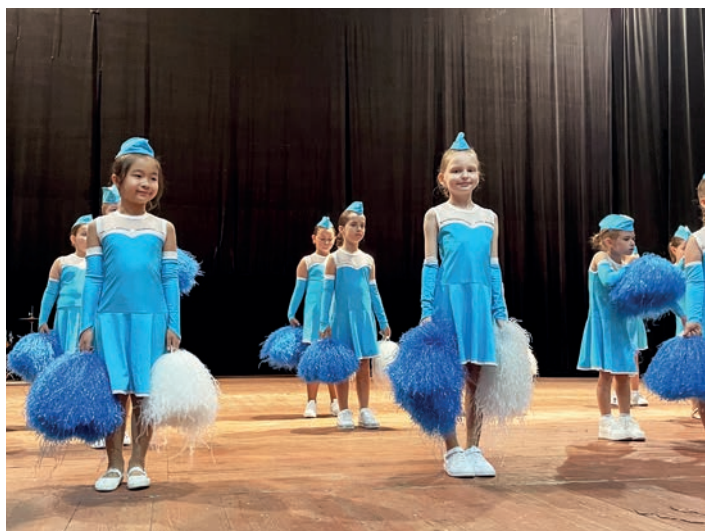
Mažoretky na Svátku matek