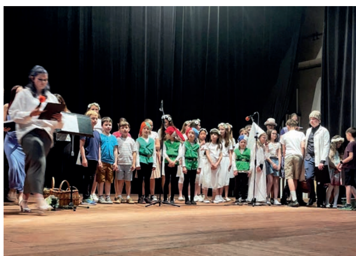
Pěvecký sbor na svátku matek