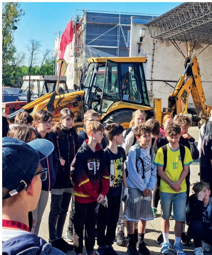
Den Země – návštěva Služeb města Bzence

Věnujeme se také sportovním aktivitám. V okresním finále atletické soutěže Pohár rozhlasu si naši žáci vedli skvěle: děvčata