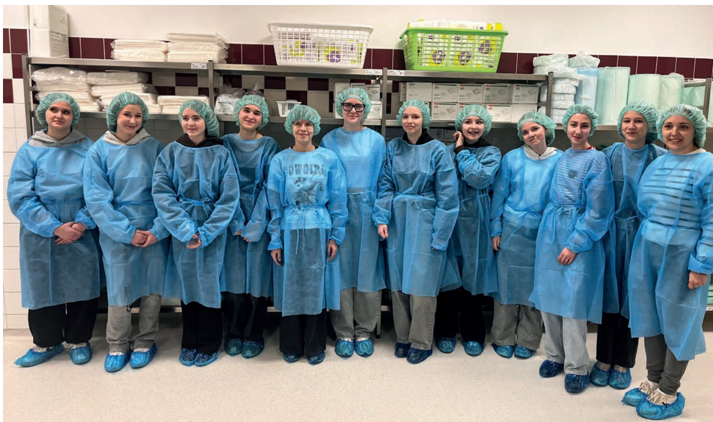
Na exkurzi v kyjovské nemocnici