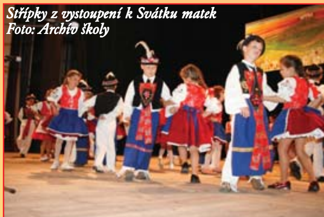
Střípky z vystoupení k Svátku matek