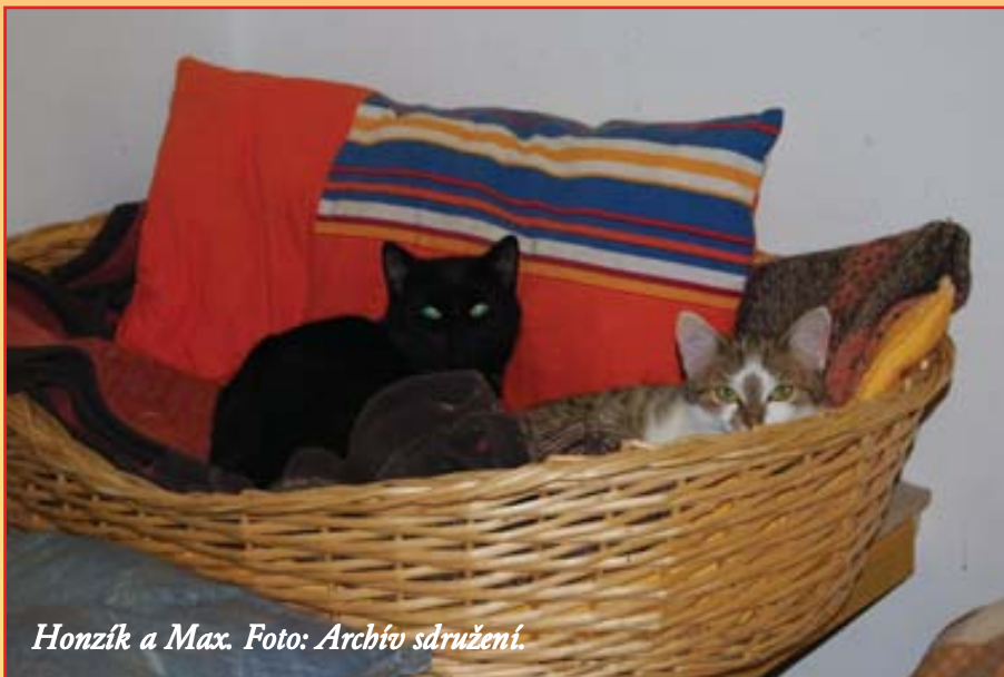
Honzík a Max.