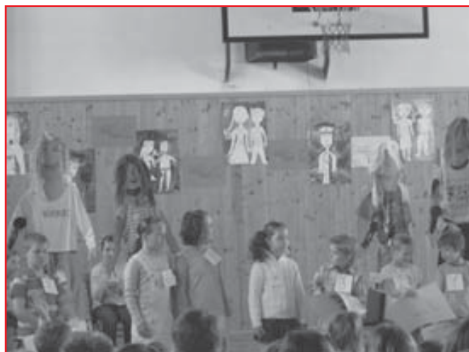
Oceňování nejlepších malých zpěváků.