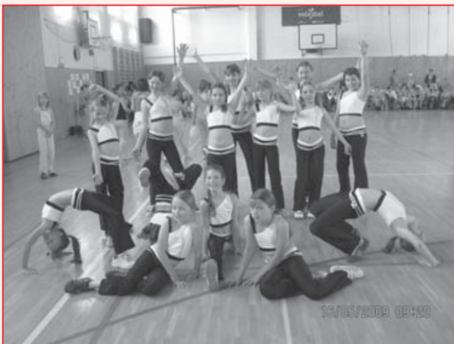
Děvčata po úspěšném vystoupení.